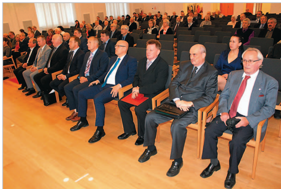
Česká akademie zemědělských věd (ČAZV) uspořádala v aule Mendelovy univerzity v Brně slavnostní zasedání

Velmi významnou součástí ČAZV je publikační činnost. První číslo časopisu Ochrana rostlin vyšlo v roce 1921. Od roku 2011 je ČAZV vydavatelem i odborným garantem jedenácti mezinárodních odborných časopisů. Většina časopisů je im-