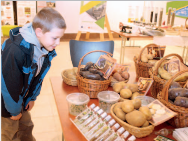
Expozice Výzkumného ústavu bramborářského zaujala i děti

se to týká rostlinné nebo živočišné výroby, či potravinářů. „Portfolio je opravdu velké, takže hravou a nezávislou formou může ukázat vědu nejen dospělým, ale i dětem,“ dodala.